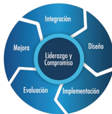
Marco de Gestión de Riesgos (ISO 31000)

Riesgo es el “efecto de la incertidumbre en los objetivos”. Este efecto puede ser una desviación positiva o negativa de lo que se espera (ISO 31000). La Gestión de Riesgos se refiere a una “aplicación coordinada de recursos para minimizar, monitorear y controlar la probabilidad y/o impacto de eventos desafortunados o para maximizar la realización de oportunidades” (ISO 31000).