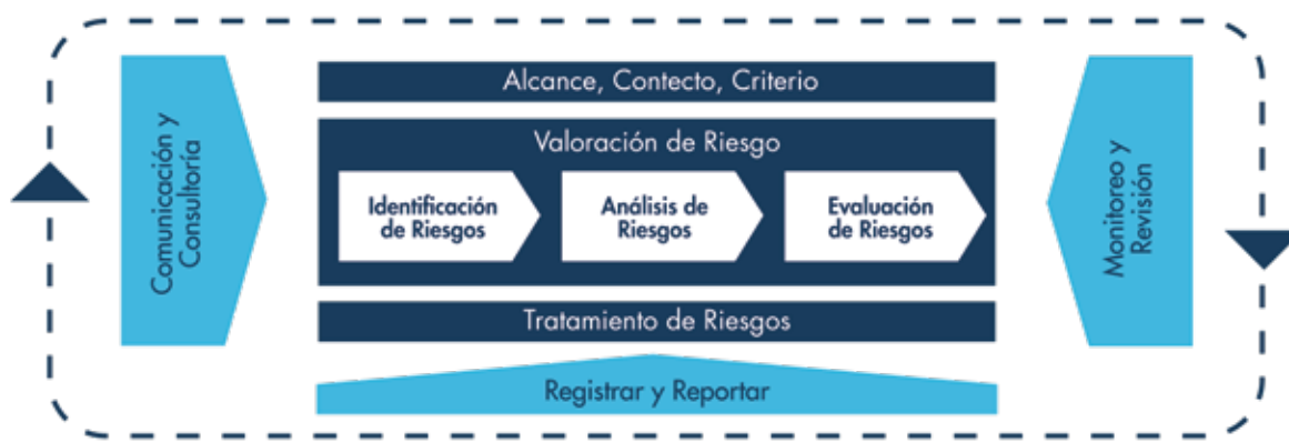
Proceso de Gestión de Riesgos (ISO 31000)